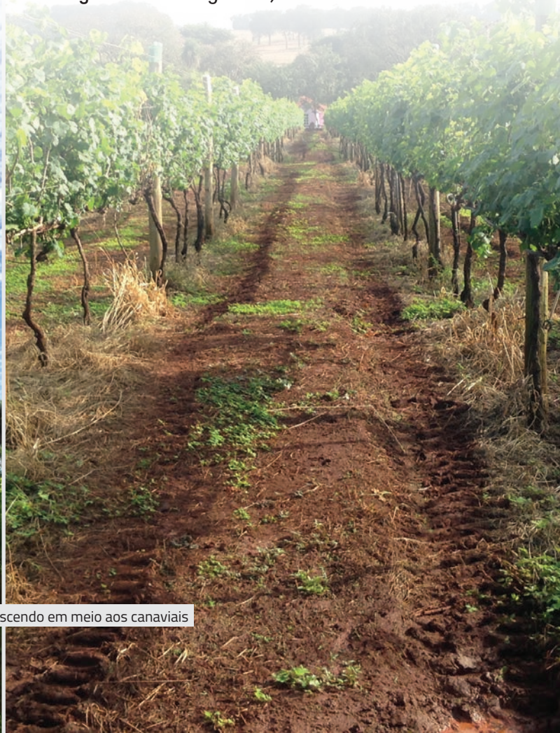
PLANTAÇÃO DE UVAS: Crescendo em meio aos canaviais