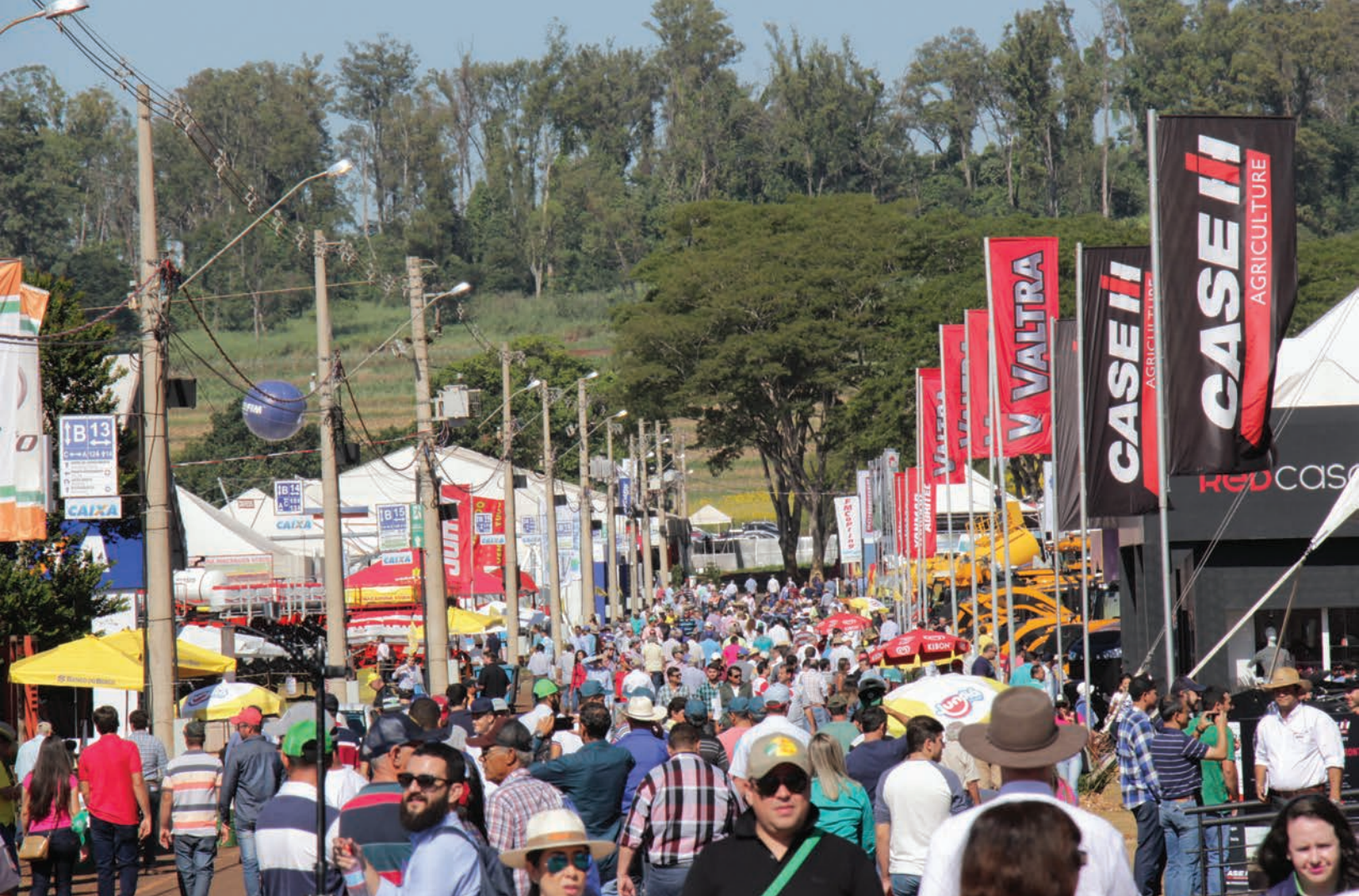
AGRISHOW: Na próxima edição o produtor poderá ver como funciona o sistema de integração lavoura/pecuária