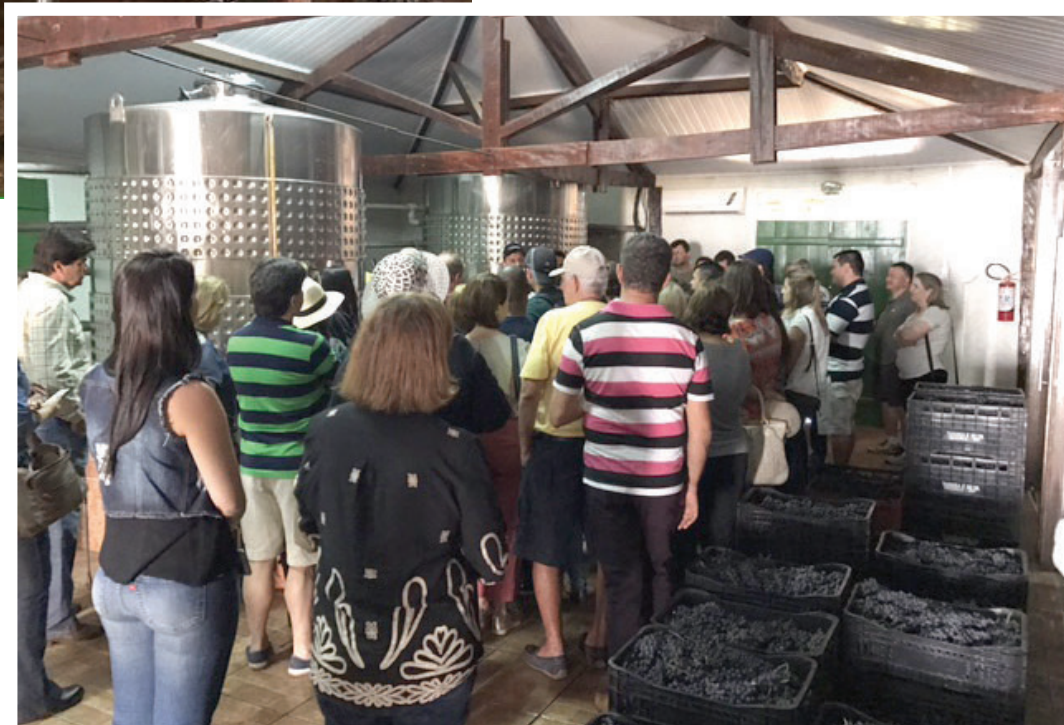
Visitantes participam de visitas monitoradas e de DEGUSTAÇÃO

Grappa Tradicional Caminho do Ouro Grappa Reserva em Carvalho