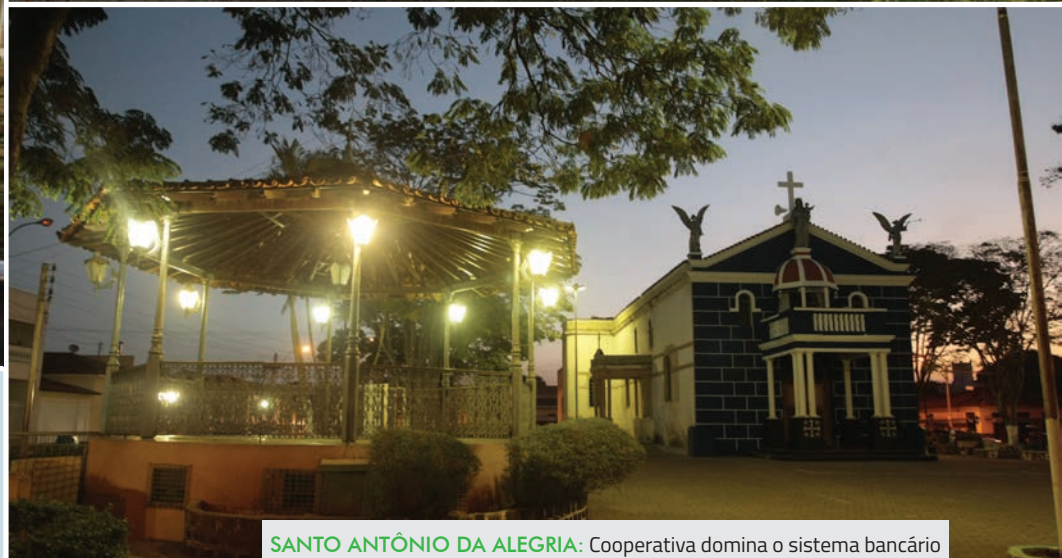
SANTO ANTÔNIO DA ALEGRIA: Cooperativa domina o sistema bancário

ficos. “A desmistificação desta crença tem sido feita em ações e projetos que mostram e destacam os benefícios do cooperativismo”, completa o presidente do Sicoob.