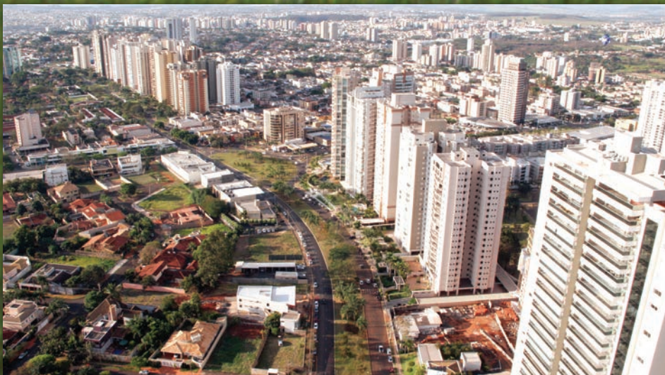
RIBEIRÃO PRETO: Base econômica consolidada