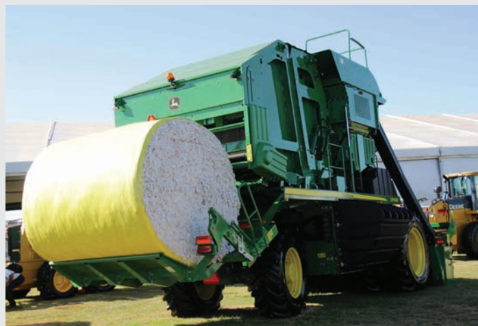
John Deere: consolidada na categoria automotiva