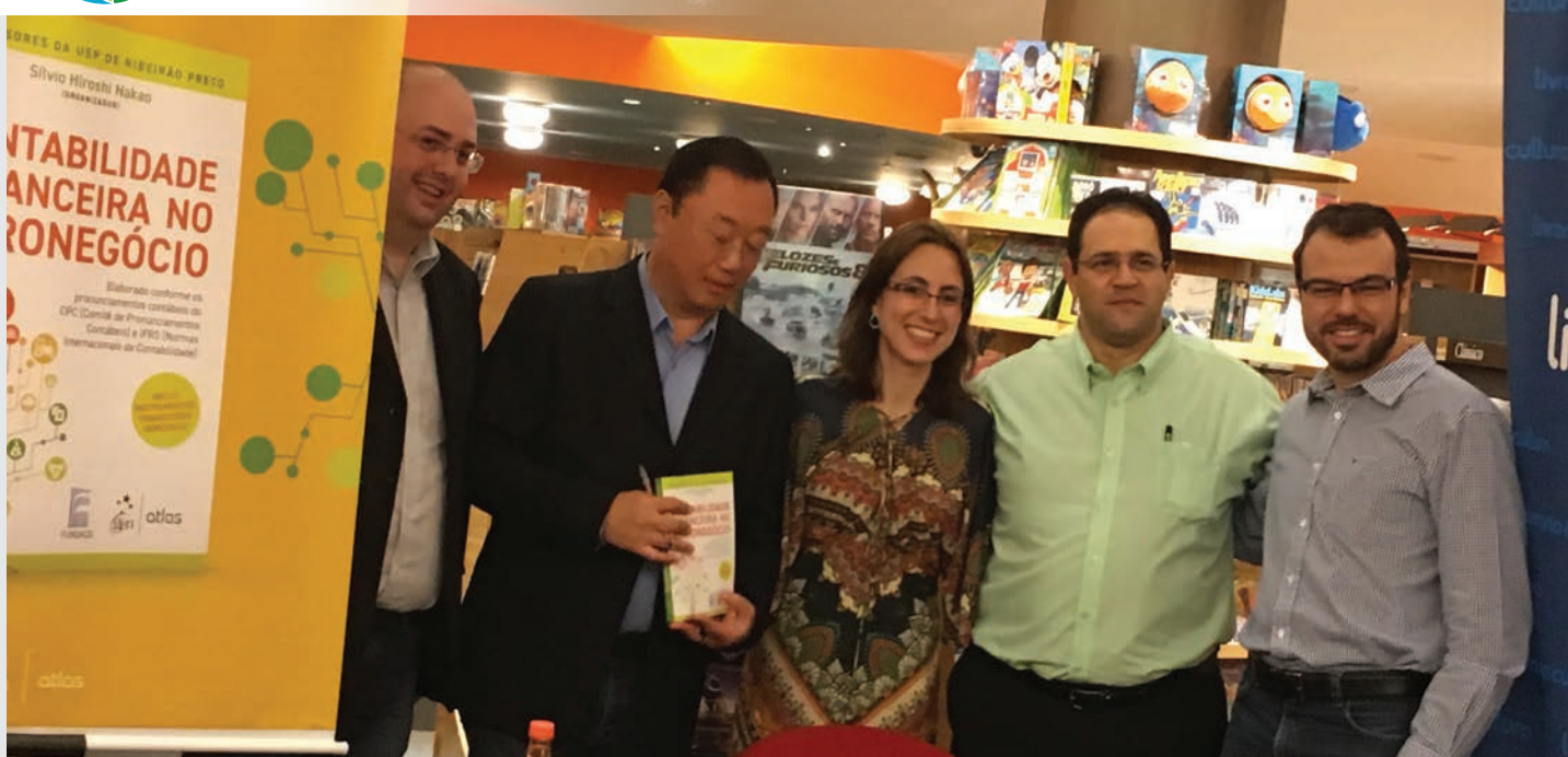
LANÇAMENTO de livro do agronegócio